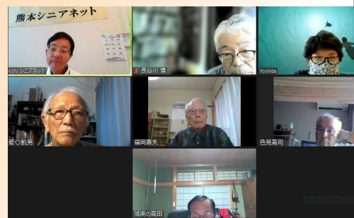
アドバイザー会議参加（中央） 2022年8月