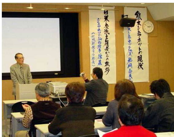
(2003年2月 日米井戸端会議で発言中)

私としては、ピン・ポイントで教えて欲しかったのに、いつももといから、順を追って指導されます。時々じりじりしたり、歯向かって、平気でゆっくり指導なさいます。本当にありがたい、かけがえのない先生でした。