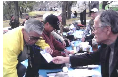
↑ 毎年 熊本城でやっていた観桜会でも、いろんな方に声掛けされていました。