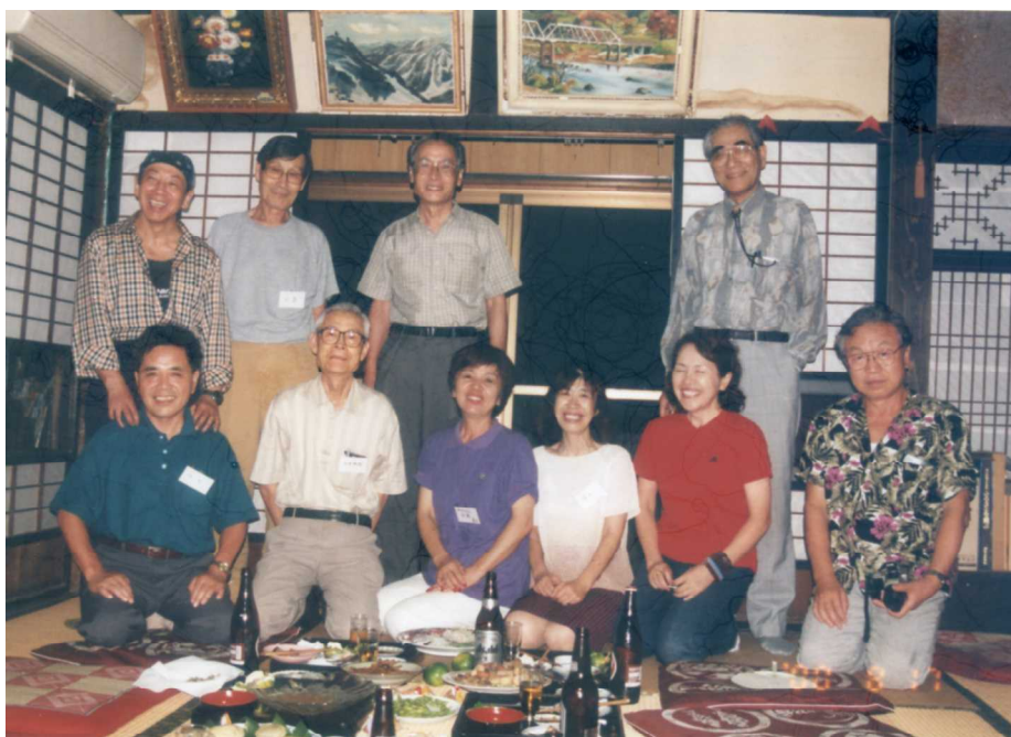
2000年8月歩師 奇屋に集合

左から竜之介 さん、めだかさ ん、福岡先生、 そして国宗さ ん。後列4人は 仲良く現在天国 在住