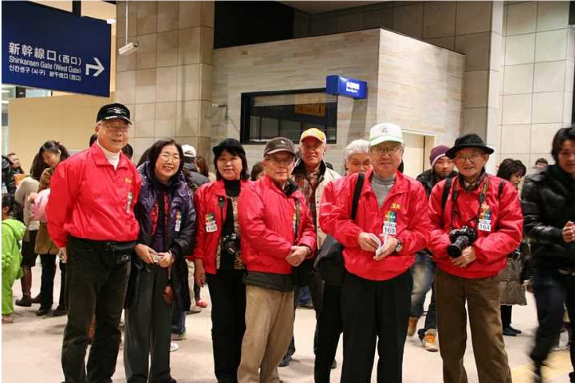
九州新幹線開業イベントへの参加